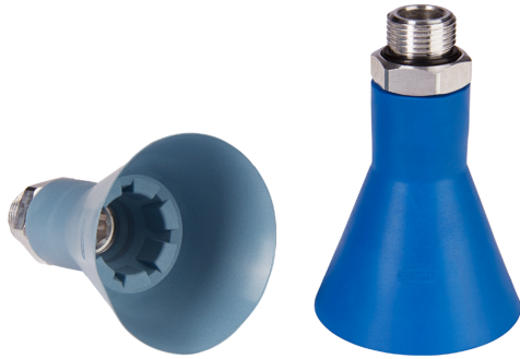
Ventosa para Bin-Picking SVE